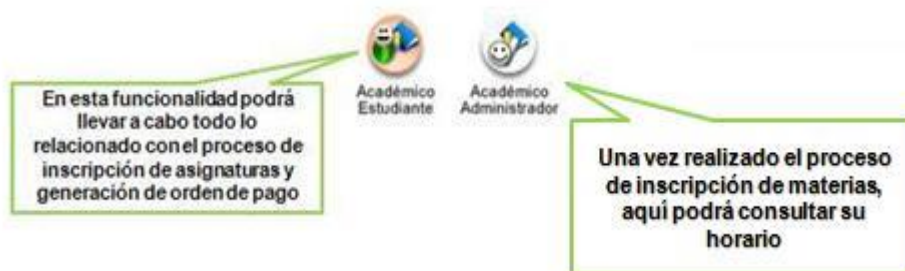
Figura 4. Para inscribir materias se debe acceder por la opción que dice "Académico Estudiante".

Después de haber ingresado al sistema encontrará las siguientes opciones: