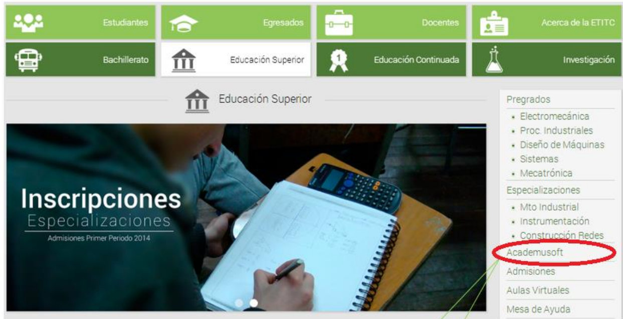
Figura 2. Página de acceso al aplicativo.

Aquí deberá dar clic en el icono resaltado en el ovalo rojo o en su defecto el botón “Ingreso Academusoft”, al dar clic aquí será direccionado a la pantalla donde podrá digitar su usuario y contraseña asignado (Figura 3).