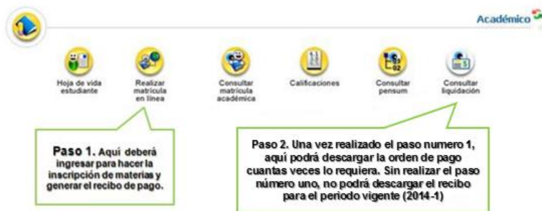
Figura 5. Para el proceso de inscripción de materias debe escoger la opción “Realizar matrícula en línea”. Si se sigue el orden mostrado podrá llevar a buen término su proceso de registro de materias y pago de matrícula.

Para continuar seleccione la opción “Académico Estudiante”, una vez realizado encontrará las siguientes opciones: